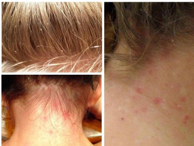
Täide nahud kuklas