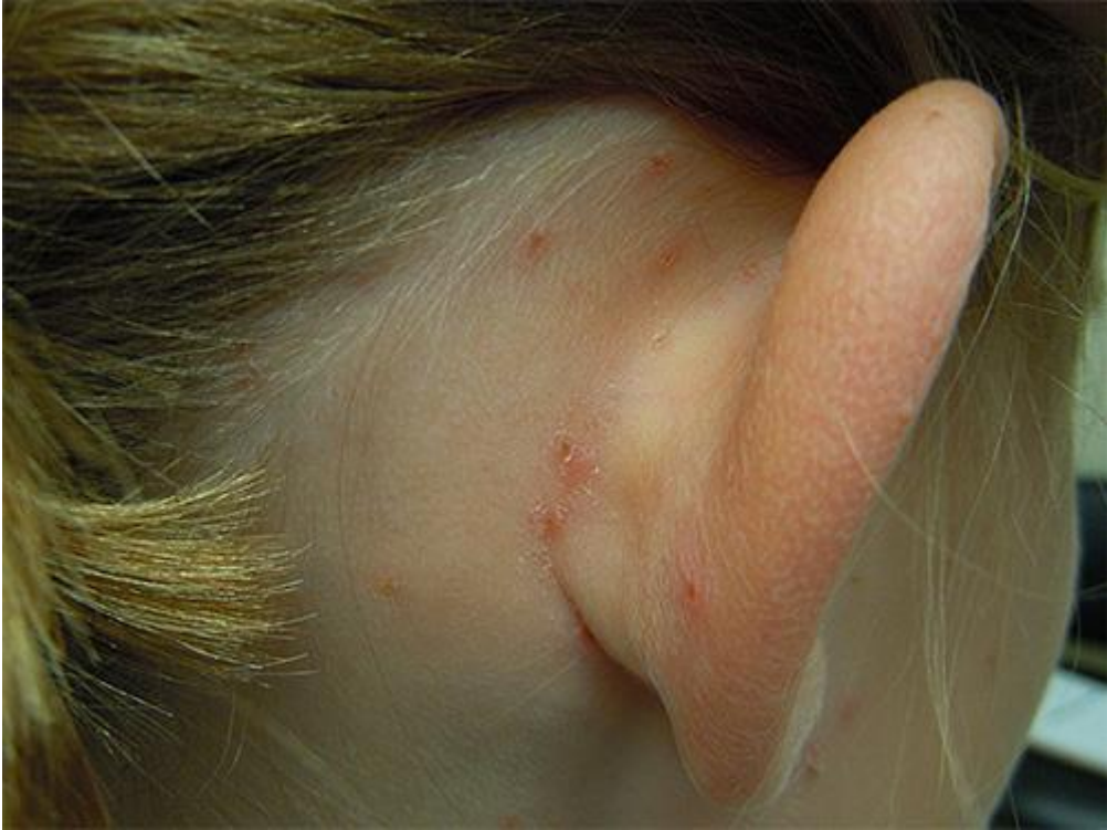
Täide nahud kõrvade taga